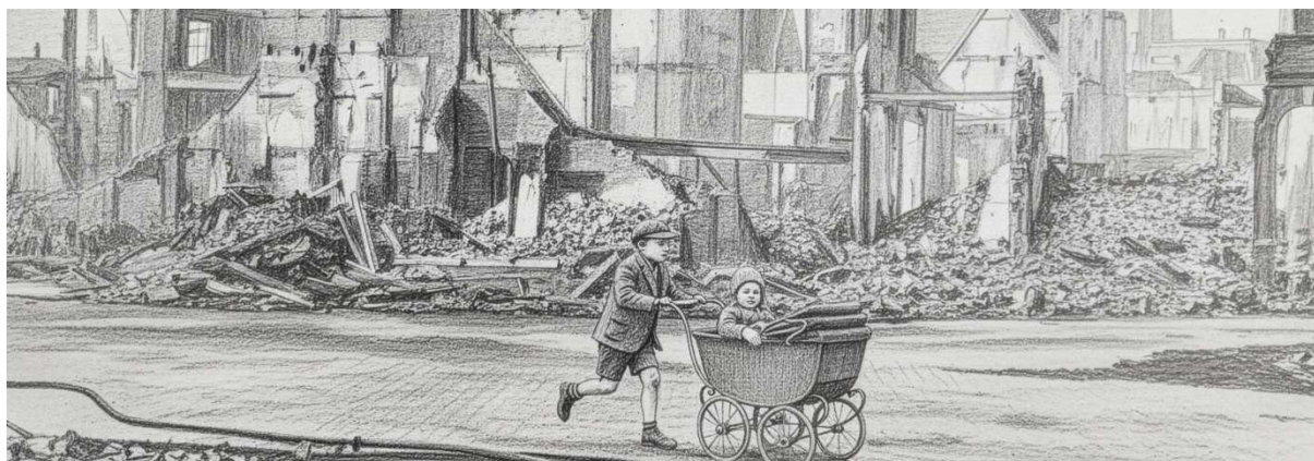
still - beginscène uit het boek 'De stad in je hoofd'