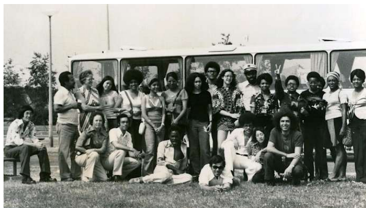
Groepsreis Surinaamse en Antilliaanse studenten naar Parijs in 1972