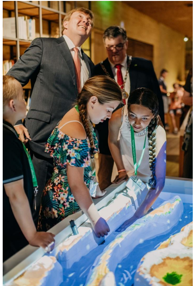
De Sandbox

De Oergrond licht het ontstaan van de stuwwal en de geschiedenis van het regionale landschap toe. Het toont de fauna uit de ijstijd naast eeuwenoude zwerfstenen met daarin topstukken uit de geologische en paleontologische collectie van De Bastei. Het verleden wordt letterlijk tastbaar in de Kanongang en bij de archeologische resten. De Bastei presenteert deze unieke archeologische vondsten met lichtprojecties. Deze schetsen hoe de ligging aan de rivier het leven in en om de stad al zeer lang beïnvloedt, van de Romeinse tijd tot en met de Tweede Wereldoorlog. De resten van verdedigingswerk De Stratemakerstoren, een historische bastei naar het concept van Albrecht Dürer, zijn integraal opgenomen in het nieuwe gebouw.