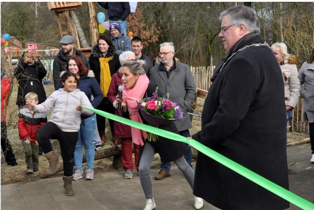
Officiële opening van een Groen Schoolplein