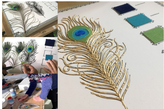
Ontwerp van de 3D pauwenveer

Omdat de ándere zintuigen voor deze doelgroep veel belangrijker zijn. Ook de inrichting van een ruimte is niet voor iedereen toegankelijk. Zo zijn er vaak obstakels, onduidelijke routes, geluiden door elkaar heen. Door intensieve samenwerking van ontwerper en haar team is een inclusieve tentoonstelling gemaakt: gebruik maken van geuren, structuren en aan te raken objecten. Tekstborden en graphics in een groot contrast en waar mogelijk gebruik maken van reliëf en contouren bleken oplossingen te zijn. Alle teksten kregen QR-codes zodat ze worden voorgelezen op je telefoon.