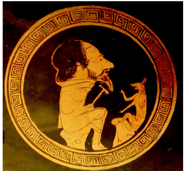
Antiek vaasplaatje van Vos die aan Aesopus over zichzelf en andere dieren vertelt.

trok van Jean de La Fontaine, die ze bewerkte en op rijm in het Frans herschreef. Hij vulde zijn collectie aan met een enorme hoeveelheid fabels uit allerlei bronnen. Hij vond fabels van Aisopos die niet in het werk van Phaedrus stonden, las Horatius en Avienus, raadpleegde Indiase en Italiaanse teksten en hoorde fabels van landgenoten. En sommige verhalen verzong hij zelf. Zijn verzameling bestond tenslotte uit 239 fabels, die hij actualiseerde om kritiek en advies te geven op de mensen van zijn tijd. Deze klassieker van de Franse literatuur werd ongekend populair in heel Europa en zo werden zijn fabels gemeengoed.