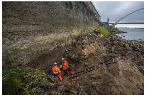
Controle van de fortmuur in de dijk

Dat gebeurde in 2022. In project Waalfront wordt het gehele gebied rondom de Honig fabriek ontwikkeld met woningbouw, kantoren en een park op de plek van het voormalige fort. In het park zijn de contouren van het fort herkenbaar. En in het ontwerp van het park is rekening gehouden met toekomstige eisen aan de dijk: een hogere kruin en mogelijke coupures, als de Waal steeds hoger stijgt. Eén parkeerkelder onder een appartementengebouw is zelfs integraal onderdeel van de waterkering. Zo is het erfgoed opnieuw onderdeel van de oplossing in een veranderend klimaat.