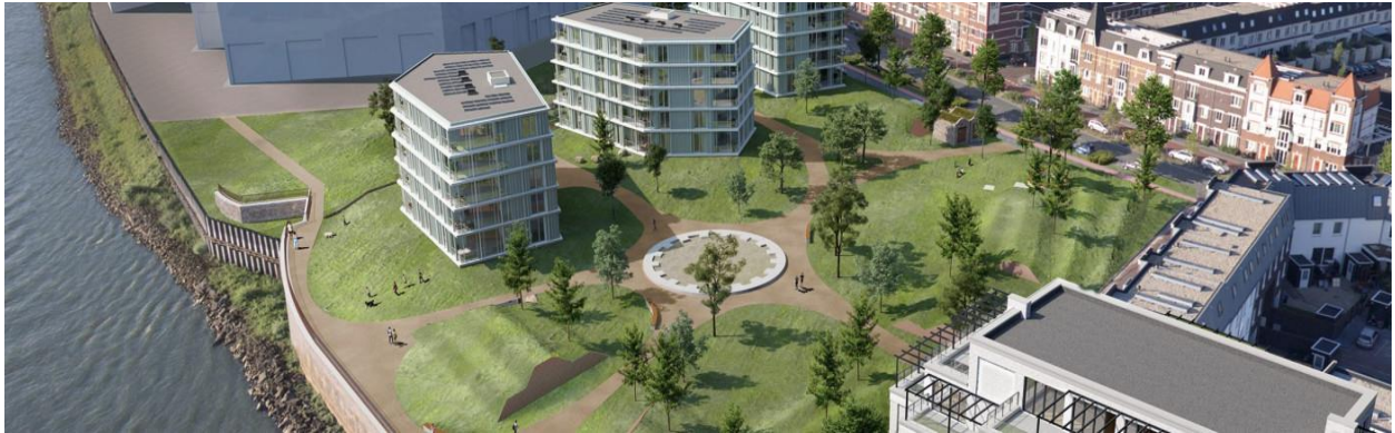
Park Fort Kraijenhoff - realisatie 2023