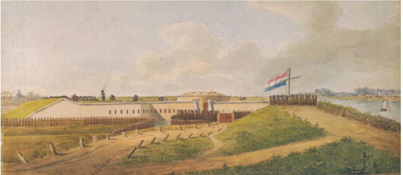
Fort Kraijenhoff 1826-1914

De naam Kraijenhoff (of Krayenhoff) is in Nijmegen niet te missen: de Krayenhofflaan, het Krayenhoffpark, de Krayenhoffkazerne en sinds kort het nieuwe wooncomplex Park Fort Krayenhoff op de plek van het voormalige fort. Wie was dan die Kraijenhoff?