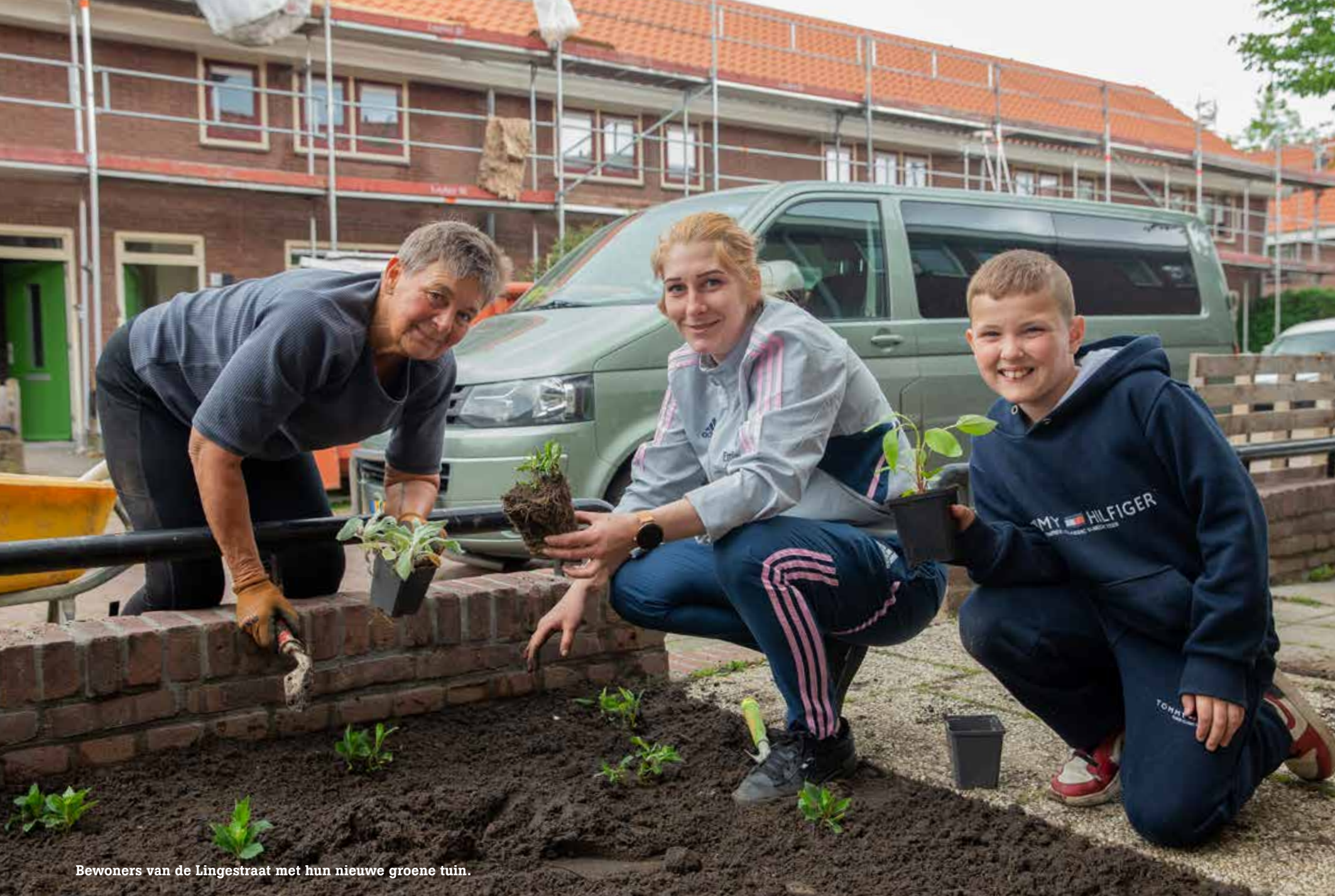
Bewoners van de Lingestraat met hun nieuwe groene tuin.