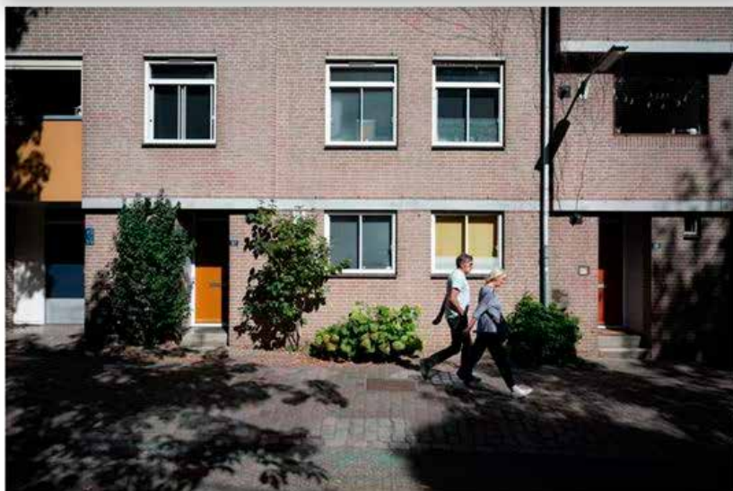
▲ Een geveltuin in de Nonnenstraat in de Nijmeegse Benedenstad.