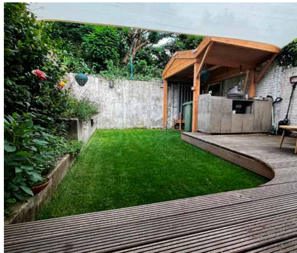
Een tuin voor en na tuinadvies van een van de Steenbreek tuinontwerpers