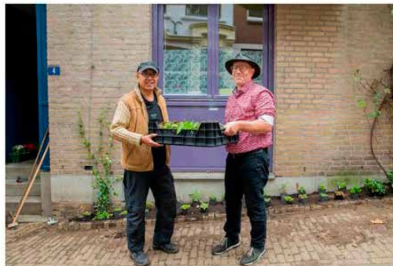
Foto: De bewoner van de Priemstraat en Wethouder Brom tijdens de geveltuinen doedag 23 september 2023 .

Eerder dit jaar zijn bewoners van onder meer de Kromme Elleboog, Lange Brouwerstraat, Oude Haven, Ridderstraat, Parkweg en Parkdwarsstraat aan de slag gegaan met het vergroenen van de stoepen voor hun woning. Tijdens gezellige doedagen hebben bewoners met elkaar ruim 109m2 groen aangelegd met inheemse, gifvrije planten. Op 23 september lag de focus op de straten rondom de Kitty de Wijzeplaats, waaronder de Nonnenstraat, Priemstraat en Smidstraat. Wethouder Brom was aanwezig om een kijkje te nemen bij dit mooie initiatief en het laatste plantje in de grond te zetten.