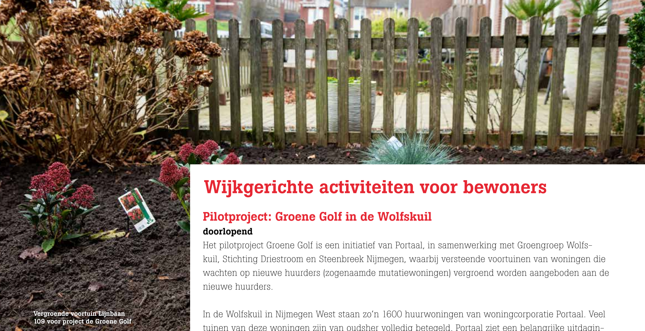
Vergroende voortuin Lijnbaan 109 voor project de Groene Golf